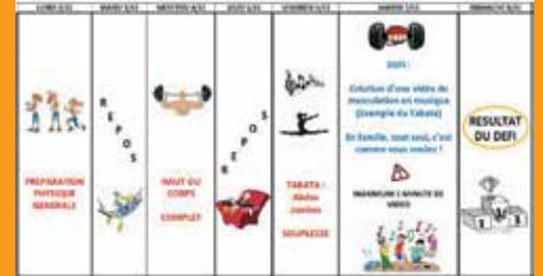
Planning de la semaine 1 confinement