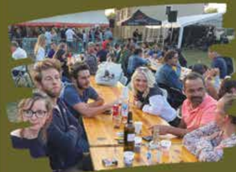
Repas à la journée des associations