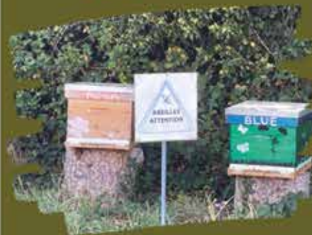
les ruches municipales à l'espace Chanard