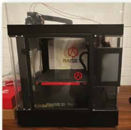
l'imprimante 3D du Fablab

Vous serez surpris et en sortirez enrichi par la découverte et le partage de savoir.