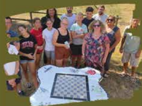
Réception du chantier pépites à l'espace Chanard