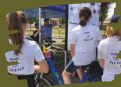
mai à vélo