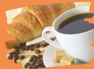
Petit déjeuner avec les acteurs économiques

Ces travaux ont été conduits du 31 mai au 29 juillet.