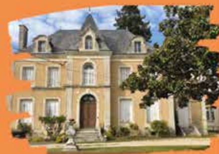
le Fablab au 42 route de Chauvigny

Fabrication du prototype d'un dôme (découpe des tasseaux de bois sur place, impression des œillets à l'imprimante 3D, découpe du tissu ... ) Toutes les étapes ont été réalisées sur place.