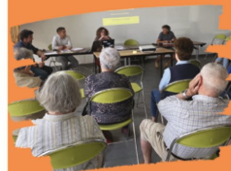
Réunion avec les riverains impactés par les travaux