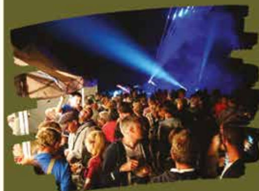
Soirée feu d'artifice

Plus de 500 personnes s'étaient donné rendez-vous pour cette première animation estivale.