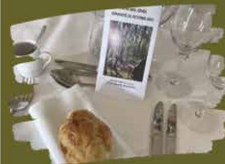
Repas des aînés