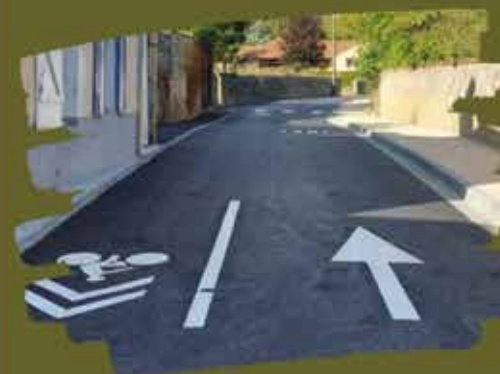
Réalisation des travaux rue de la gare

Aussi, Il a été procédé également à une mise en sens unique de la rue de la Gare à partir de la rue des Platanes et de la rue de la Vallée dans le sens rue de la Vallée vers RD 951.