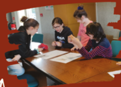
Groupes de travail du CCJ

La commission "Journée festive" a vu l'aboutissement de l'après-midi festif pensé et construit pendant un an. le 27 août. Lors de cette journée, étaient proposés gratuitement à tous les habitants de Grand Poitiers, des jeux de société, et sportifs : foot, tir à l'arc, badminton, casque de réalité virtuelle, mur digital, lasergame extérieur dans le parc de la Sapinette (cf page 17).