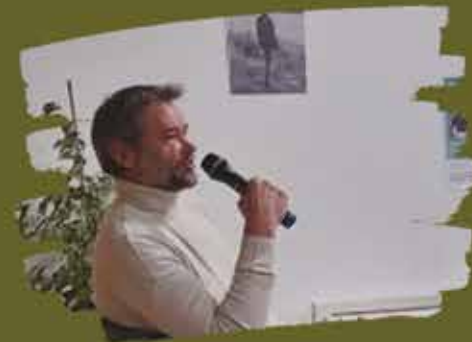
Franck Bouysse à la médiathèque

Franck BOUYSSÉ a publié une quinzaine de romans dont Grossir le ciel (Prix SNCF du polar 2017), Né d'aucune femme (Prix des libraires 2019) et Buveurs de vent (Prix Jean Giono 2020). Il a raconté son écriture, ses personnages, son parcours... avec son authenticité et sa sincérité. Le public a particulièrement apprécié ce moment de partage riche et rare.