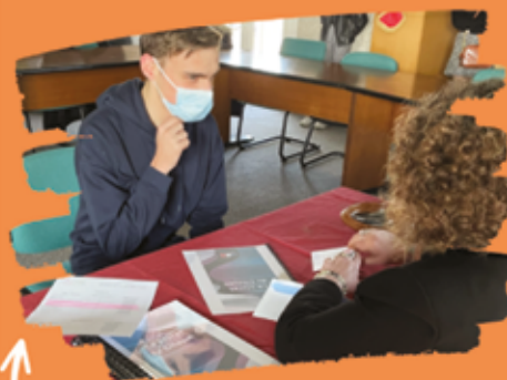
la cérémonie citoyenne était une première dans notre commune.