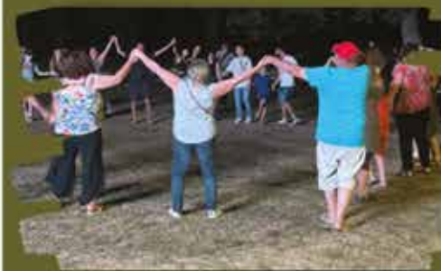
Soirée guinguette éphémère