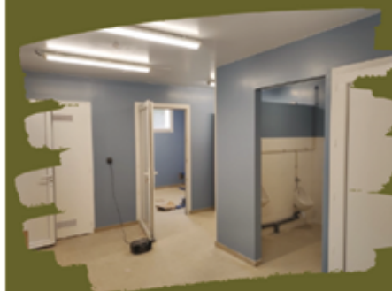
Réfection des vestiaires

Les illuminations de fin d'année ont été conservées cette année car ne présentent qu'un faible enjeu sur les consommations (LED). Toutefois elles sont fonctionnelles sur les mêmes plages horaires qu'indiqué précédemment, pour une période réduite entre les semaines 50 et 2 (soit 4 semaines de moins qu'à l'accoutumée).