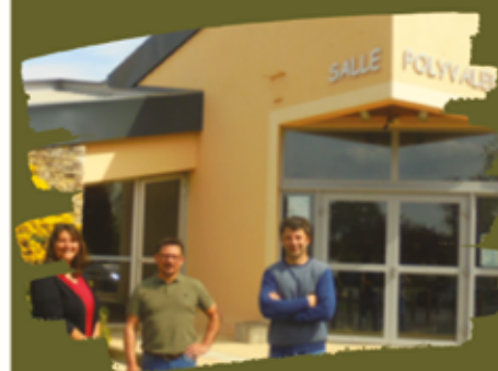
Réception du chantier toiture salle polyvalente