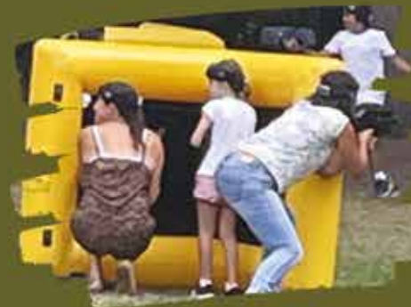
Partie de lasergame à St Ju refête l'été