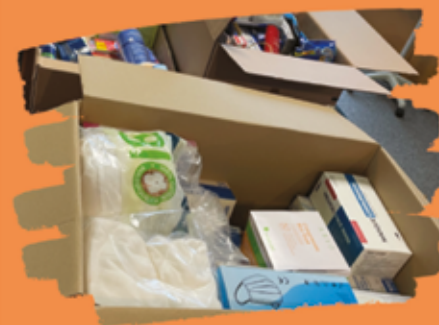
Collecte pour l'Ukraine